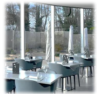
L'Atelier du Cerisier

Paleron de bœuf en daube provençale, dessert : Pavlova fraises et éclats de pistaches.