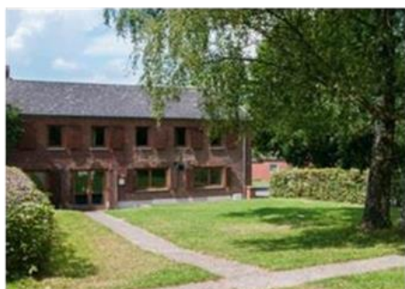
Boleil : Le Relais du Fayt à Grandglise amisdelanature@an-ath.be

Plusieurs sections A mis de la N ature de Belgique vous accueillent dans leur gîte, leur chalet ou leur camping, en harmonie avec la nature, à des prix démocratiques.