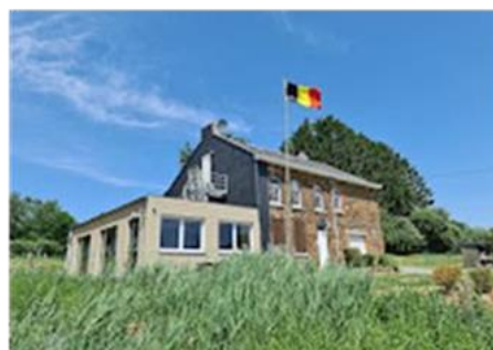
La Reid : La Gervava lagervava@gmail.com