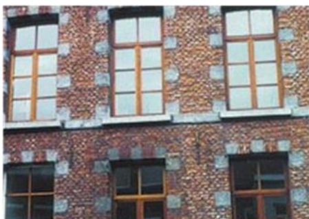
Ath : La Maison Verte amisdelanature@an-ath.be

Plusieurs sections A mis de la N ature de Belgique vous accueillent dans leur gîte, leur chalet ou leur camping, en harmonie avec la nature, à des prix démocratiques.