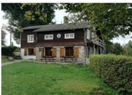
Trois-Ponts : Les Gattes reservationslesgattes@gmail.com