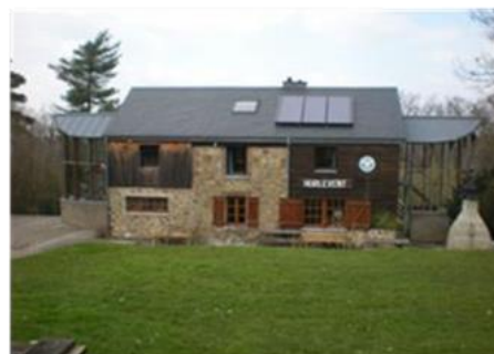
Fraipont (Trooz) : Le Hurlevent Hurlevent.anlg@gmail.com