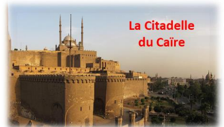
La Citadelle du Caire

Après un séjour au Caire et la visite de la citadelle, les mosquées et les souks, nous découvrirons Gizeh et ses 3 célèbres pyramides ainsi que la nécropole de Sakkarah.