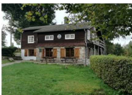
Trois-Ponts : Les Gattes reservationslesgattes@gmail.com