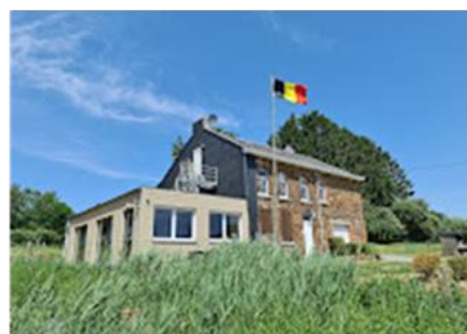
La Reid : La Gervava lagervava@gmail.com