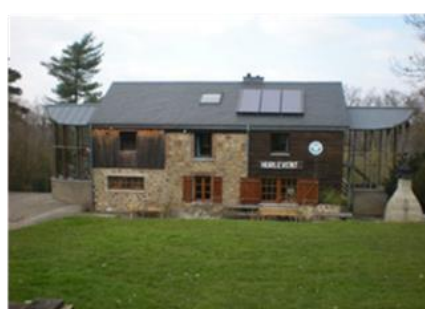
Fraipont (Trooz) : Le Hurlevent Hurlevent.anlg@gmail.com