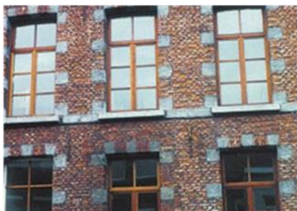
Ath : La Maison Verte amisdelanature@an-ath.be

Plusieurs sections Amis de la Nature de Belgique vous accueillent dans leur gîte, leur chalet ou leur camping, en harmonie avec la nature, à des prix démocratiques.