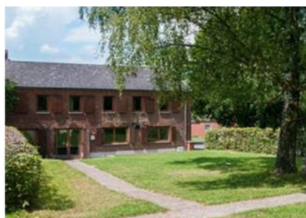
Beloeil : Le Relais du Fayt à Grandglise amisdelanature@an-ath.be

Plusieurs sections Amis de la Nature de Belgique vous accueillent dans leur gîte, leur chalet ou leur camping, en harmonie avec la nature, à des prix démocratiques.