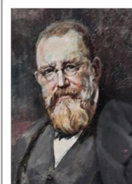
Portrait de Jean Capart, égyptologue belge

Stagiaire au palais de Justice de Bruxelles, Capart s'est forgé une certitude : "Il le dit très clairement à ses parents, lorsqu'il revient du palais de Justice le premier jour : je ne pratiquerai jamais ce métier de menteur" Et c'est heureux car c'est grâce à lui que la Belgique va briller au firmament égyptologique ! Grâce à une bourse du concours interuniversitaire des docteurs en Droit de Belgique, Capart voyage à travers l'Europe, mais "il ne va pas étudier le droit, il va étudier l'égyptologie. Donc il va commencer par se rendre aux Pays-Bas puis en Allemagne en Angleterre et puis en France et durant un an ou deux, il va vraiment étudier l'égyptologie au plus près des plus grands égyptologues de son temps en particulier Flinders Petrie à Londres et Gaston Maspero au Collège de France".